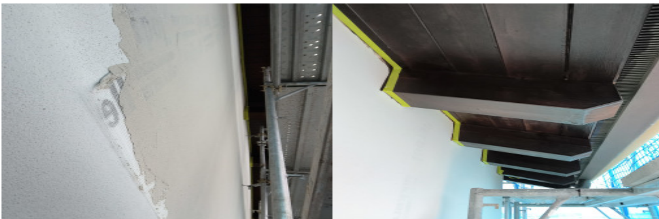
Rasatura torre scenica