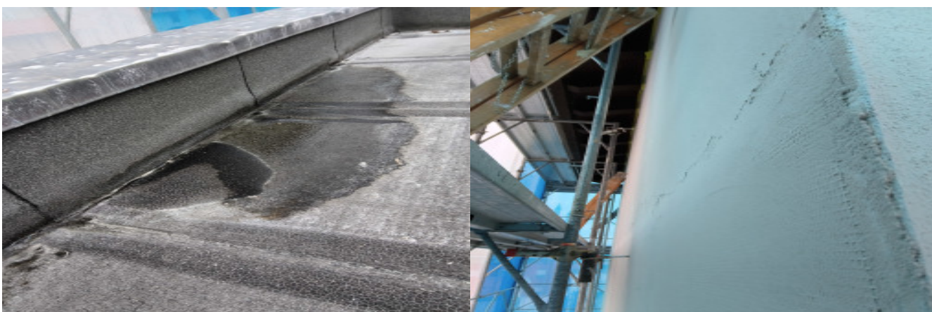
Infiltrazione su tetto piano ingresso