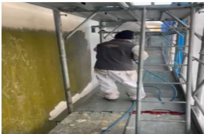
lavaggio muro lato condominio