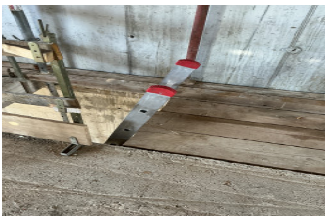
Scala non legata e sbarco <100 cm