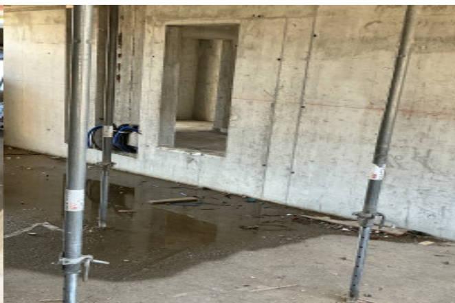
Dislivello > 50 cm