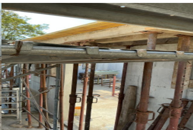
Fissare tavole con fascette di plastica anziché filo di ferro