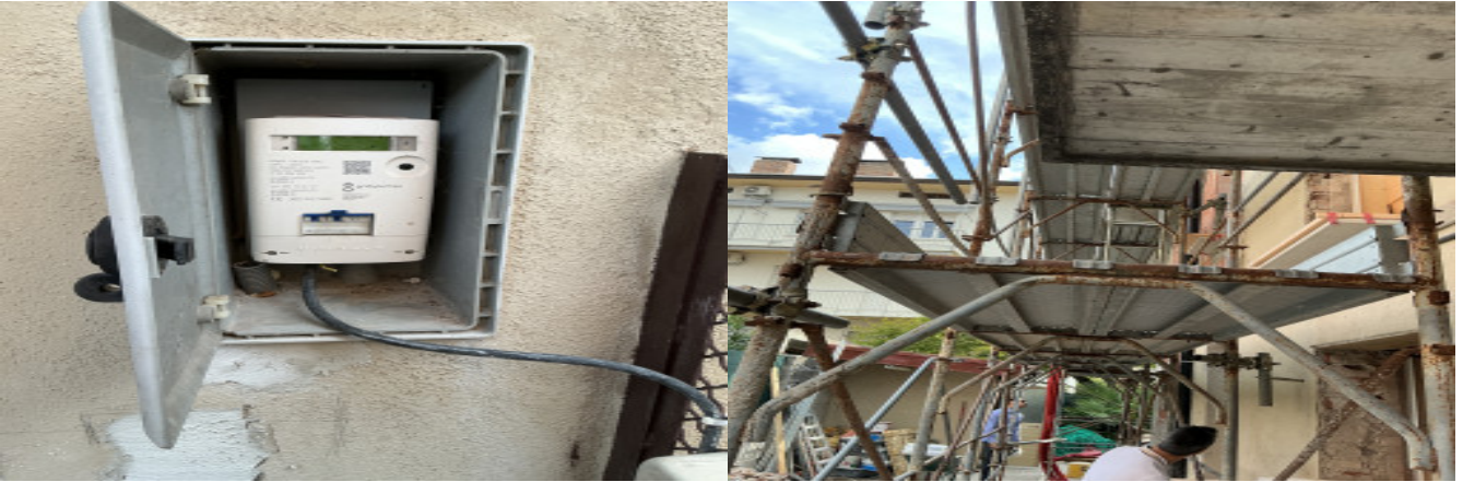
Messa a terra