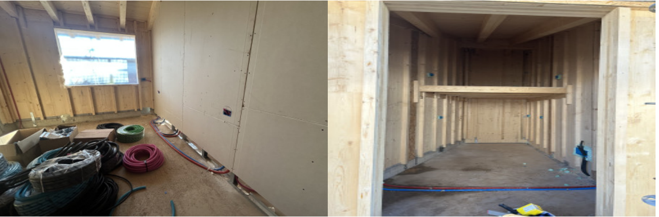
Impianti senza isolante