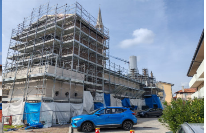
Prospetto Sud Est