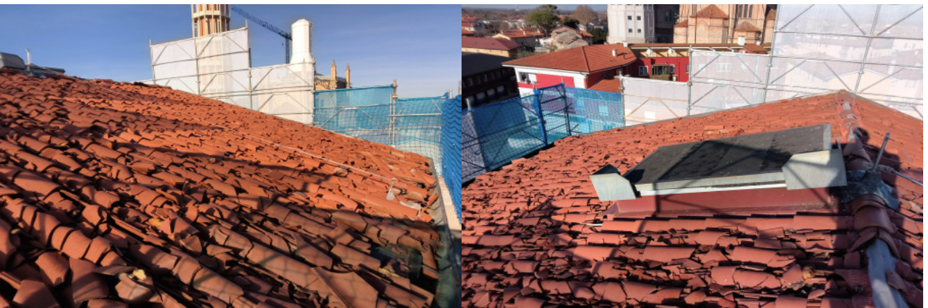
linea vita con tirante parallelo alla linda - tetto alto particolare linea vita falda verso piazza San Paolo