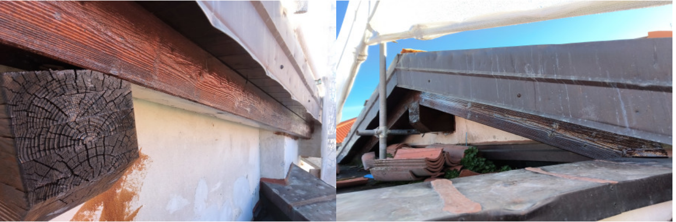
prima mano impregnante